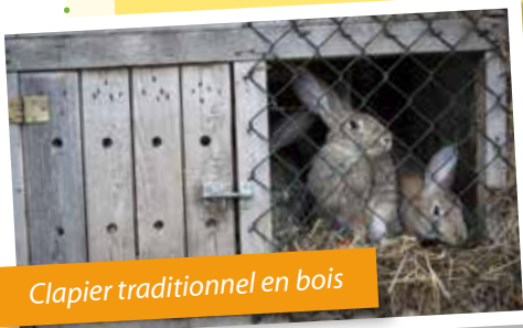
Clapier traditionnel en bois

La domestication des lapins ne s'est produite qu'au moyen âge, bien après les autres animaux de la ferme ! Pour le loger, des cages appelées clapiers , au début en bois puis très vite en ciment, étaient alignées dans un endroit abrité contre le mur d'un bâtiment.