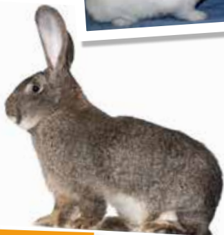
Géant des Flandres