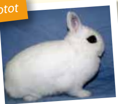
Nain de Hotot